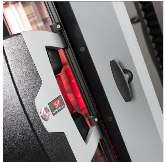
AVE2が恒温槽に取り付けられた状態

* インストロンは、光の屈折作用によるノイズを減少するためカメラと試験片の間の空気の流れをコントロールすること、および低電圧LED照明システムにより全ての光学条件を確実にすることについて、アメリカ合衆国とヨーロッパでの特許を保持しています。US7,047,819B2、US7,610,815B2、およびEP1,424,547、B1。